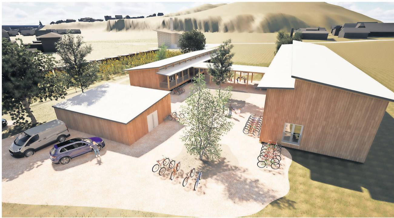
Visualisierung des geplanten Basecamp Pfadi Willisau, das in der Käppelimmatt realisiert werden soll.

Josef Albisser: Über 115 aktive Kinder und Jugendliche profitieren direkt davon. Zeitgemässe Räumlichkeiten sind